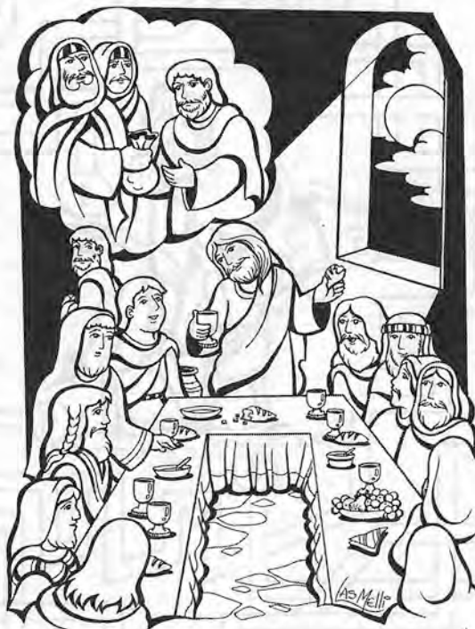
Domingo de Ramos Pasión de nuestro Señor Jesucristo

le quitaban la caña y le golpeaban con ella la cabeza. Y terminada la burla, le quitaron el manto, le pusieron su ropa y lo llevaron a crucificar. Al salir, encontraron a un hombre de Cirene, llamado Simón, y lo forzaron a llevar su cruz. Cuando llegaron al lugar llamado Gólgota (que quiere decir lugar de «la Calavera»), le dieron a beber vino mezclado con hiel; él lo probó, pero no quiso beberlo. Después de crucificarlo, se repartieron su ropa echán-