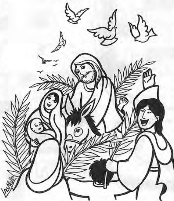
Domingo de Ramos Pasión de nuestro Señor Jesucristo

Toda la muchedumbre que había concurrido a este espectáculo, al ver las cosas que habían ocurrido, se volvía dándose golpes de pecho. Todos sus conocidos y las mujeres que lo habían seguido desde Galilea se mantenían a distancia, viendo todo esto.